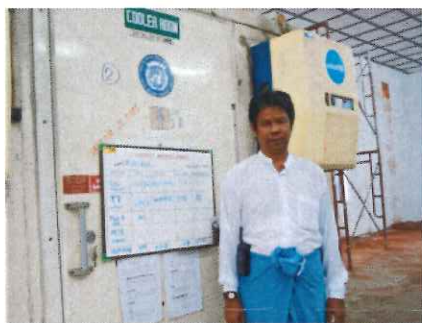
ミャンマー ワクチン保冷庫の技術者