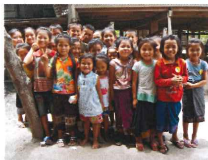
たくさんの笑顔を守るワクチン

彼のような技術者によって耐用年数10年の保冷庫が15年間も使用可能な状態に維持されています。皆さまからのご支援は、現地の人々の力とともに最大限に活用されています。