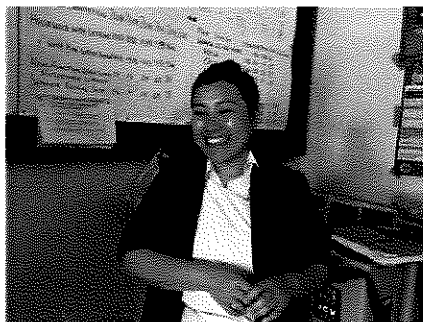
ブータン王国 ダンプ病院の看護師