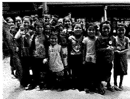
たくさんの方の笑顔を守るワクチン

彼女が担当するダンプ病院管轄地のワクチン接種率は100%。ここでは、曜日を決めたワクチン接種などを行っています。