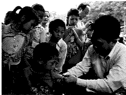
ラオス キューカリア村でのワクチン接種

「ワクチンを打つようになってから、病気で亡くなる子どもが減った。ワクチンを支援してくれるJCVと日本の皆さんに感謝を伝えたい。」